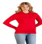
Women's Heavy Polo LS